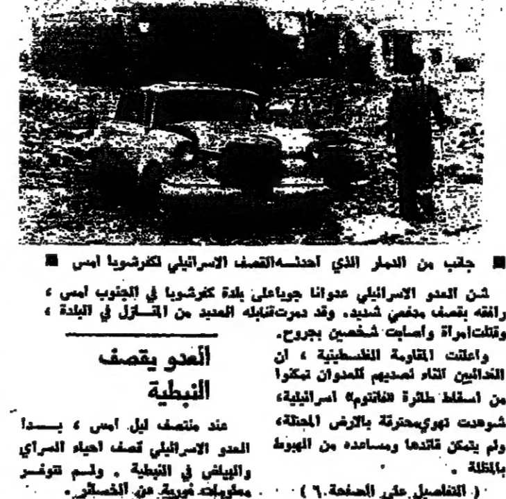
طفلة بيني ايام جنة القليلة برح القدي الذي ذهبت شحبة العدوان على كفرشوبا امس